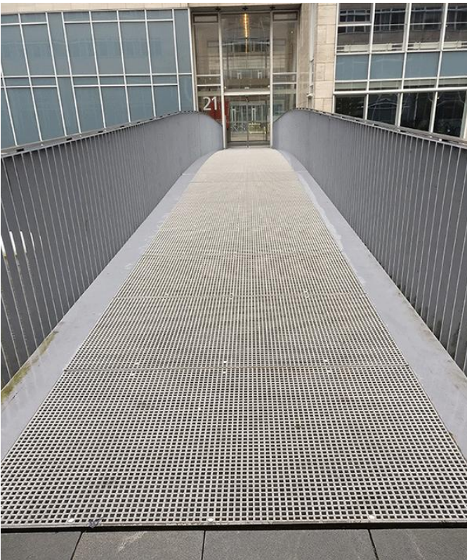
Ponte con rete antiscivolo in fibra di vetro FRP, Copenhagen, zona dell'Università ( link )

Rispetto alle reti d'acciaio, le reti in fibra di vetro sono più leggere (circa 1/3), non sono soggette a corrosione, non richiedono verniciatura, sabbiatura o sostituzione, si puliscono facilmente con acqua ad alta pressione.