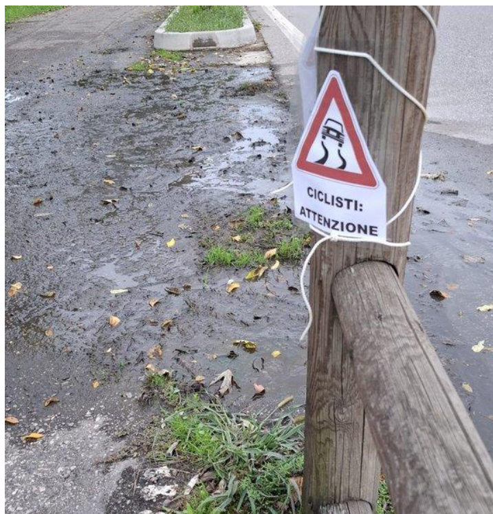
Segnale artigianale posizionato da volontari su un tratto di ciclabile che collega Montorio con Ponte Florio