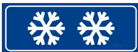
Pannello integrativo II.6/h, cristalli di ghiaccio: strada sdrucchiolevole per ghiaccio

Il comma 2 specifica che particolari condizioni (pioggia, gelo o altre cause localizzate), devono essere indicate mediante i pannelli integrativi modello II.6 unitamente a quelli integrativi modello II.2 (per le estese) e modello II.5 (per indicare l'inizio, la continuazione o la fine). Per pioggia e gelo si devono utilizzare i pannelli II.6/h e II.6/i.