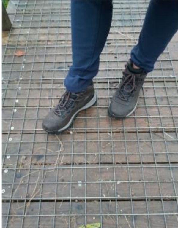
Filo saldato a maglia quadrata. Diametro del filo: \varnothing 1,75 mm, altezza: 101,6 cm, lunghezza: 25 m, peso: 39 kg, Danimarca ( link )

Oppure di rete antiscivolo in fibra di vetro .