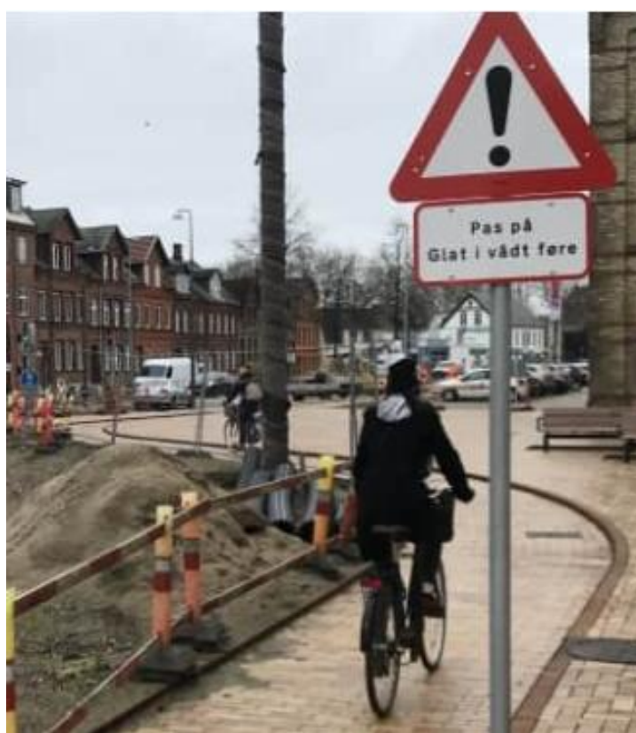
Segnale di pericolo con pannello integrativo "Fare attenzione alle superfici scivolose", Odensee, Danimarca