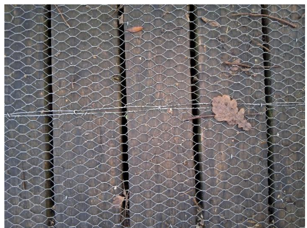
Copenhagen, rete metallica antiscivolo su ponte di legno (foto Guia Biscaro, novembre 2025)