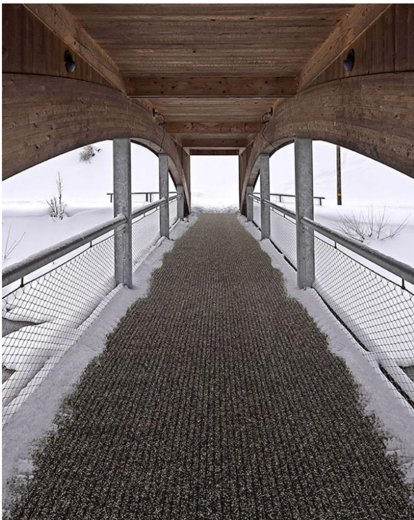
Ponte con tappeto antiscivolo, Danimarca ( link )

In Italia, si trovano esperienze di impiego di tappeti antiscivolo, ad esempio, a Crema, sulla passerella ciclopeditale “Giorgio Bettinelli”, che collega il quartiere di Castelnuovo con Via IV Novembre. La sua pavimentazione di legno si ghiacciava a causa delle temperature rigide e dell’umidità dovuta al fiume sottostante. Il Comune ha posato un tappeto in tessuto speciale antiscivolo su tutti i 90 metri della passerella.