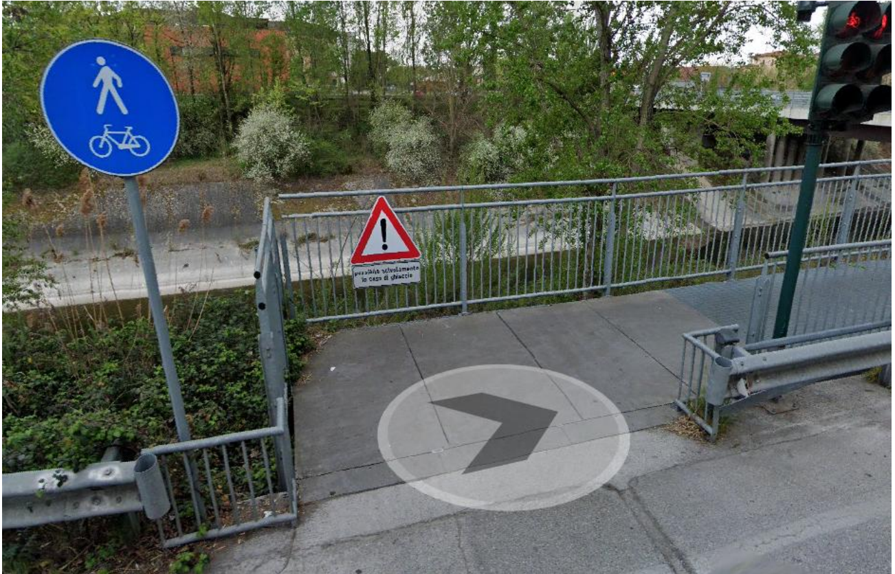
Segnale "altri pericoli" con pannello integrativo "possibile scivolamento in caso di ghiaccio", Mantova