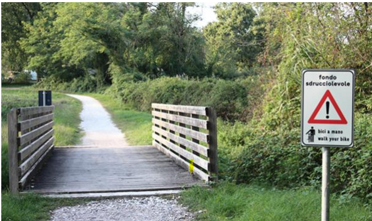
Segnale "fondo sdruciolevole" sull'anello ciclopedonale del Lago di Comabbio, Varese